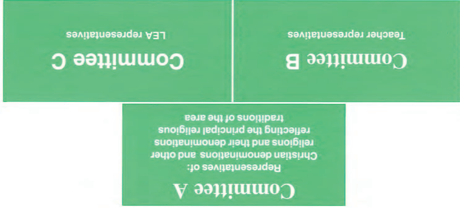
Figure 2: The Composition of a SACRE

Each of these committees has equal voting rights (one vote per committee).